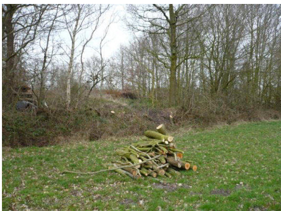
Houtwallen voldoende beschermd? B en W kunnen, zonder goede toets, gewoon nog ontheffing verlenen voor afbraak.

In het plan worden de natuur en landschapswaarden "de hemel in geprezen". Ze worden van zeer groot en onmisbaar belang voor de gezondheid van de streek en voor de aantrekkelijkheid (voor wonen en recreëren) van de gemeente beschreven. Maar zodra er een conflict met een ander belang ontstaat, kan B en W zonder meetbare en transparante criteria, ervan afwijken en het belang van natuur en landschap ondergeschikt maken.