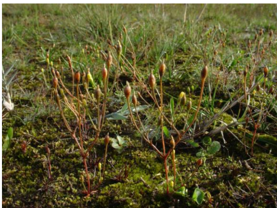
In de oostoever van De Burgumer Mar; de enige groeiplaats van de zeer zeldzame Draadgentiaan in Fryslân (excl. Wadden).

dorp. In de gemeenteraad werd al geuit dat het plan breed werd gedragen in het dorp. Een opmerking die ook al niet gebaseerd is op gedegen onderzoek. De, door ons willekeurig ca. 100 gevraagde dorpsgenoten reageren overwegend geschrokken en weten weinig tot niets over deze plannen. Zelfs bewoners van de Snakkerburen blijken de plannen niet te kennen. De ondernemer heeft dus ook nog veel uit te leggen..... Wij hebben de Natuur- en Landschapsvereniging "De Wâlden, De Marren" daarom gesteund in hun bezwaren. Die zijn inmiddels bekend bij Gemeente en Provincie. Mag er dan geen uitbreiding plaatsvinden? Uitbreiding en verbetering van de jachthaven en camping kan, wat het bestuur van de wacht betreft, in goed overleg nog best plaatsvinden. Ook de vogelwacht is blij met de huidige situatie die de ondernemer al heeft gerealiseerd. Het huidige plan echter moet veel beter aangepast worden naar de aard en de schaal van het dorp en het meeroeverlandschap.