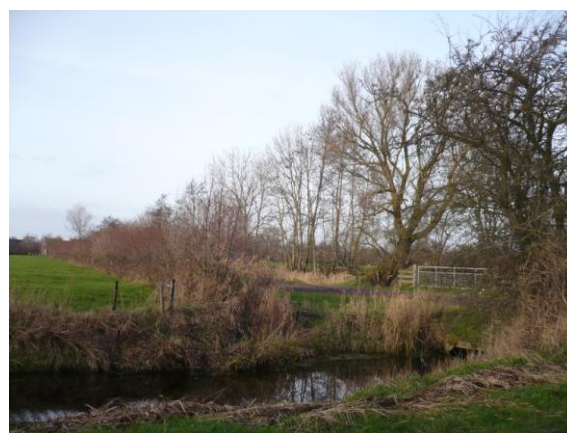
Links van de duiker de verkochte Malewei berm.

Hoe kon dit gebeuren was de veel gehoorde vraag?