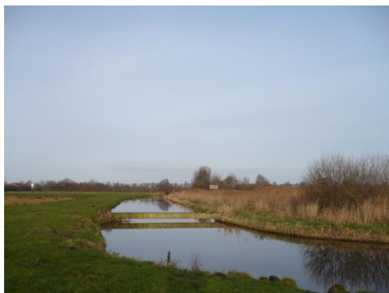
De Hielesleat in het natuurgebied bij het uitzichtpunt aan de Malewei.

wisten beide partijen en in elk geval enkele gemeenteambtenaren dat daaruit allerlei problemen, ook met Eastermarders zouden ontstaan. In diezelfde tijd speelde met dezelfde man een door het bestuur ervaren onnodige en vervelende kwestie. De bewuste man ageert namelijk al enige tijd tegen het feit dat de Hielesleat niet bevaarbaar is. De verderop in het natuurgebied gelegen overgang, in de vorm van een oude "dukdalf", moet er weg. Deze kwam er echter, mede op voorstel van de wacht, in de plaats van de, tijdens de