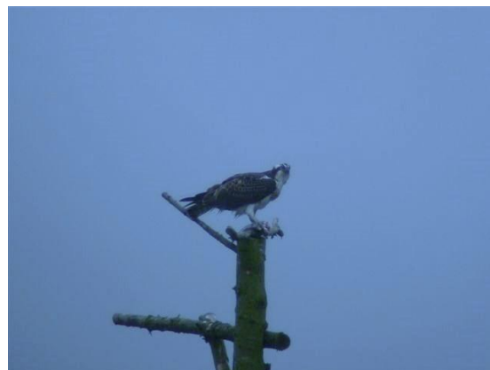
Een Visarend op de arendenboom bij het uitzichtpunt aan de Malewei, sept. 2013.

van de Leien" is glad gestreken. Inmiddels wordt er samen gewerkt aan