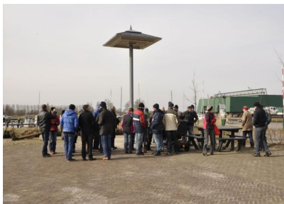
De opening aan de Snakkerbourren.

De laatste jaren staan ook de zwaluwen in de belangstelling. Daar waar nodig zijn speciale pannen voor Gierzwaluwen aangebracht. Op drie plaatsen zijn zwaluwdraden tussen palen opgericht. De belangrijkste staat bij de brug over de Lits. Deze draden worden al druk gebruikt door Boerenzwaluwen. Vooral in juni en juli als er jongen zijn uitgevlogen.