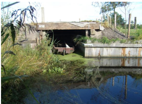
Een illegaal botenhok (2010) in de oever van De Burgumer Mar. De politiek zwijgt.....

soort gevallen, in elk geval bij de bestuurders, de kennis ontbreekt dan verwachten wij dat vooraf de kennis ten minste uit de streek wordt benut. Wij verwachten bovendien dat de bestuurders de gemaakte afspraken uit projecten en B en W besluiten zorgvuldig laten bewaken. Want als dat niet gebeurt wat zijn zulke afspraken dan nog waard. En waarom zouden wij als burgers het werk van de politici beter moeten waarderen?