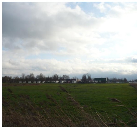
De lelijke en slecht in het meeroeverlandschap ingepaste huidige recreatieterrein aan de Lits.

op zoek naar mogelijkheden. Dat past ook beter bij onze natuur.