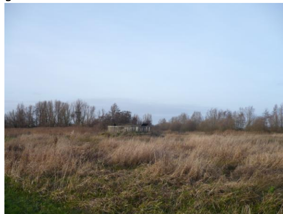
De oorspronkelijk bedoelde vorm en grootte van een uitzichtpunt om van het landschap en de natuur te kunnen genieten zonder dat er noemenswaard wordt verstoord.

Sinds deze natuurorganisatie "onze" uitzichtpunten bij de Malwei en het Pieter Jehannesgat, eerst zonder overleg, heeft veranderd, is er een jaarlijks overleg opgestart. Dit moet "ergernissen" en ook bezwaren in de toekomst voorkomen. Helaas kon het bestuur, ook samen met dat van de Natuur en landschapsvereniging "De Wâlden, De Marren", niet voorkomen de huidige "aanpassing" werd uitgevoerd. Daar balen we nog steeds van..... De nieuwe houten bakken verhinderen dat je er met groepen mensen en kleine kinderen gebruik van kunt maken. Het zijn nu ook opeens opvallende bouwwerken op de uitzichtpunten in het landschap geworden.