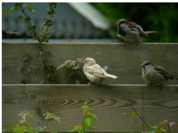
De bijna witte mus zonder rode ogen.

Lid Auke Dotinga meldt geregeld bijzonderheden uit de natuur. Hij gaf ook door dat een goede kennis van hem in Drogeham een witte Huismus in de tuin had. Op de bijgevoegde foto is nog net te zien dat het, zoals Auke al mailde, geen albino is want de ogen zijn niet rood.