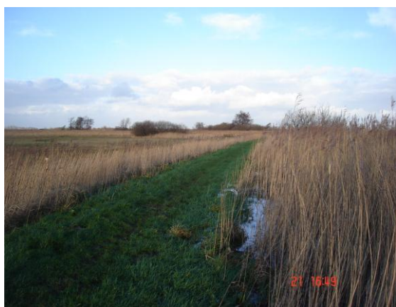
Hoogwater; gaat net niet over de kade in de Putten. Deze kade o.a. zal worden verbeterd. Het wandelpad, deel van het Kroezepaad, blijft bestaan.