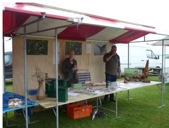
Voorlichting van de wacht: ook vrijwilligerswerk.