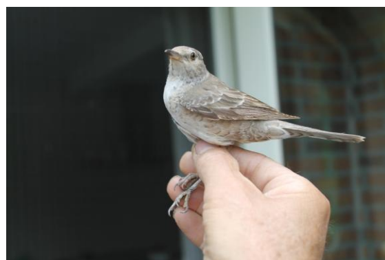
Een nieuwe vogelsoort voor Eastermar e.o.. Sperwergrasmus geringd in juni 2013 in de oever van De Burgumer Mar. Een soort uit oost Europa.

Een bijzondere vogelvangst bij ons dorp. Sperwergrasmussen zijn zeer zeldzaam in Nederland. Als ze gevangen of waargenomen worden is dat meestal in de herfst, de trektijd van de vogels. Niet in het broedseizoen zoals nu bij ons het geval was. Deze vogel werd in juni geringd.