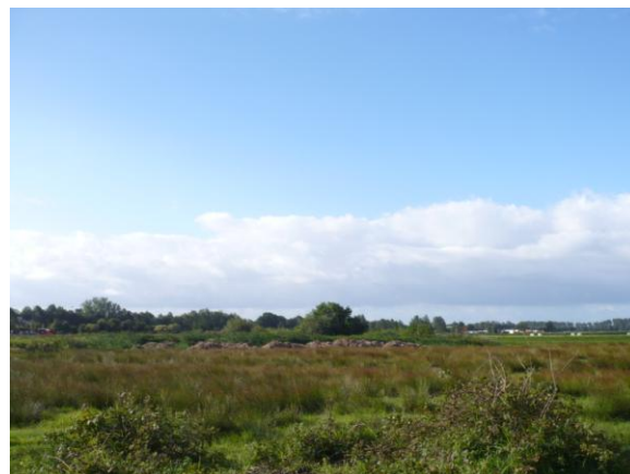
Noordhoek Bouwespolder bij Eastermar (Achterwei); geen enkele ruimte meer voor weidevogels; verruiging en verwaarlozing slaat toe.

De laatste jaren gaat het bergafwaarts met de weidevogels in de Bouwespolder. Het is een sluipend proces. Eerst ingezet door de ontwatering van het gemaaltje waarmee al het (kwel-) en regenwater het hele jaar door wordt weggemalen, later nog eens extra door het gebruik van verbeterde pad naar de zwemplaats. Controle op het ongeoorloofde gebruik van het pad is er niet. Dus, ook en vooral in de broedtijd, verstoren bazen met hun honden en brommers die er niet mogen komen, het gebied.