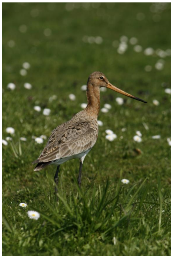
De Kening fan e Greide, Grutto, kensoort van een Skrizekrite; helaas nauwelijks aanwezig in het gebied van de ver. Eastermar's Lânsdouwe.

Lânsdouwe naar de vergoedingen die de betrokken boeren zouden moeten krijgen. Het project zou een predatieplan, verplicht door de Provincie, moeten hebben. Met de Vogelwacht is hier nog nooit over gesproken. Hetzelfde geldt voor het Faunaproject. De aanwezige en actuele streekennis wordt niet benut ("de NFW" doet het wel...). In de afgelopen jaren lijkt het erop dat het op tijd leveren van de resultaten van het vogelwacht-velddwerk voorop staat. Want dan kunnen de deelnemende ondernemers hun vergoedingen declareren.