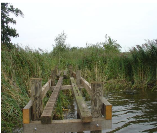
Een voorbeeld van een illegaal deel van een steiger waarvoor later achteraf en tegen de afspraken in alsnog vergunning werd verleend.

Al jaren probeert de Fûgelwacht en anderen de gemeente te houden aan het B en W besluit uit 2004 om geen nieuwe steigers meer in de oevers van de Leien toe te staan. Ook de gemeente Smalingerland voert zo'n beleid en doet dat goed. De Leien is aangewezen als kerngebied in de ecologische hoofdstructuur (EHS) en vrij recent zo ingericht dat recreatieactiviteiten in de oever niet nodig en ook niet (meer) gewenst zijn.