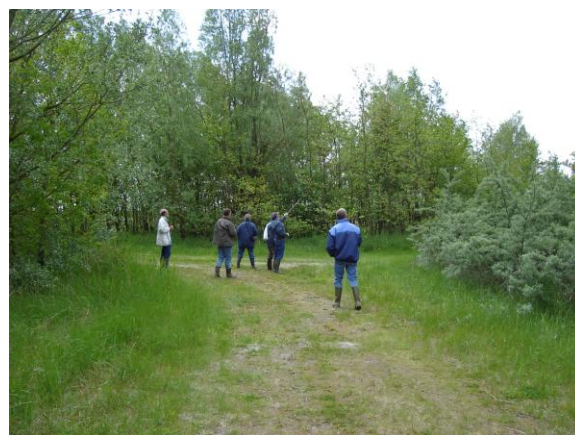
Lekker naar buiten met de vogelwacht op excursie; dichtbij is meer te beleven dan vaak wordt gedacht.