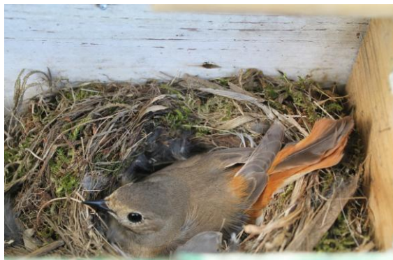
Gekraagde roodstaart (vr) broedend in speciale nestkast van de wacht.

jaren ook deel uit van het landelijke nestkastennetwerk. De gegevens ervan komen dus ook in die databank.